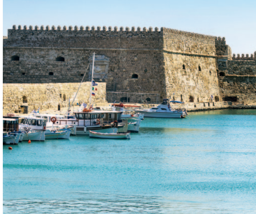
Port w Heraklionie i twierdza Koules

Cretaquarium jest obowiązkowym punktem programu zwiedzania miasta. Dzieciom spodoba się również Muzeum Historii Naturalnej Krety i Wschodniej Części Basenu Morza Śródziemnego.